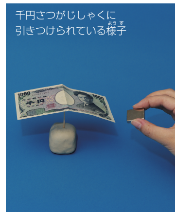
千円さつがじしゃくに引きつけられている様子

おさつにじきインクが使われているのは, そのおさつが本物かどうかをくべつできるようにするためです。電車の自動けんばいきやジュースの自動はんばいきなどの中には, じきインクのいんさつパターンをチェックして, おさつが本物かどうかをくべつするそうちが取りつけられています。