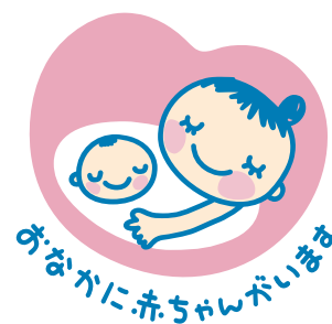
マタニティマーク

電車やバスを使うときは、おなかの中に赤ちゃんがいる人に席をゆずるなど、やさしい社会づくりのために、みなさんに何が出来るかを考えてみましょう。