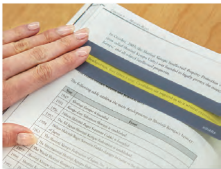
リーディングトラッカー

リーディングトラッカーは、読みたい行にあてることで、文章を集中して読むことができます。リーディングルーペは、文字が2倍に拡大されます。読むことが得意でないと感じている人はぜひ使ってみてください。